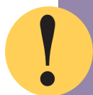
Imagem 02 – Prova

É importante ressaltar que, depois de criar a prova , é necessário associá-la à disciplina/ turma que deseja aplicar a prova. Para isso, vá em