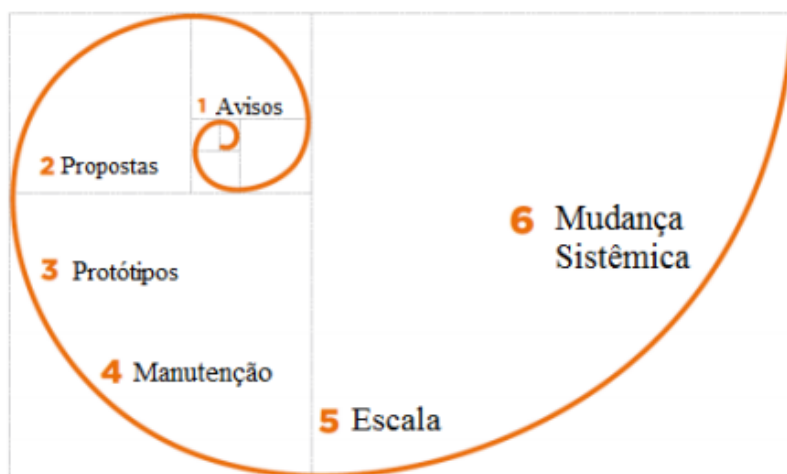
Figura 1 – Ciclo da Inovação Social