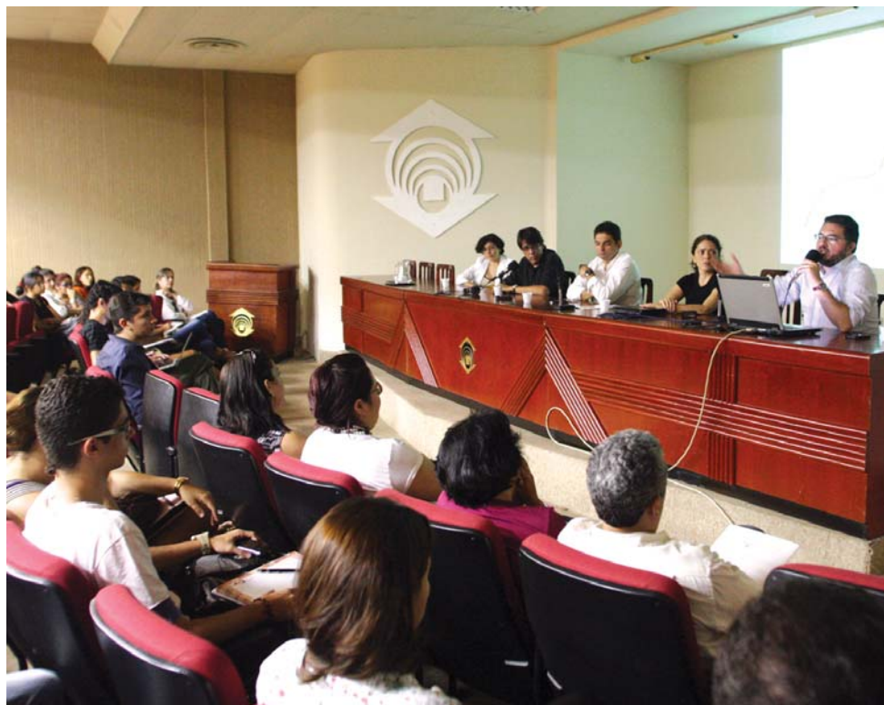
Seminário sobre comunicação empresarial reuniu diretores de grandes agências da cidade