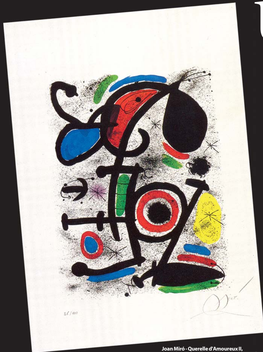
Joan Miró - Querelle d'Amoureux II, from the series Allegro vivace - Lithograph 1981 Edition of 100 - 90x60cm

A Fundação Edson Queiroz, em parceria com o Santander Cultural, do Banco Santander Banespa, traz à Universidade de Fortaleza a mostra !Mirabolante Miró. Depois de Porto Alegre, São Paulo e Niterói, Fortaleza recebe agora a exposição. São gravuras, litografias e xilogravuras do artista catalão Joan Miró, um dos mais importantes artistas plásticos do século XX. As obras fazem parte do acervo da Galeria Lelong, de Paris, responsável pela edição da quase totalidade das gravuras de Miró.