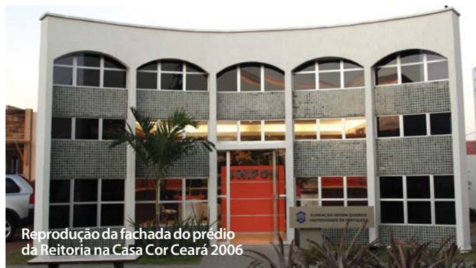
Reprodução da fachada do prédio da Reitoria na Casa Cor Ceará 2006