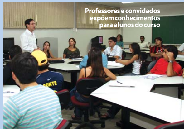
Professores e convidados expõem conhecimentos para alunos do curso

Estudantes e profissionais da área de administração e líderes empresariais nacionalmente conhecidos estiveram reunidos, de 18 a 20 de setembro, na Semana da Administração. O evento, que ocorreu no Teatro Celina Queiroz, possibilitou discussões acerca das novas perspectivas da administração, no cenário nacional e cearense. Durante a semana, cerca de 600 alunos, além de professores e convidados da área da administração, discutiram temas como plano de negócios, estratégias empresariais, mercados de capitais e caminhos para uma carreira de sucesso.