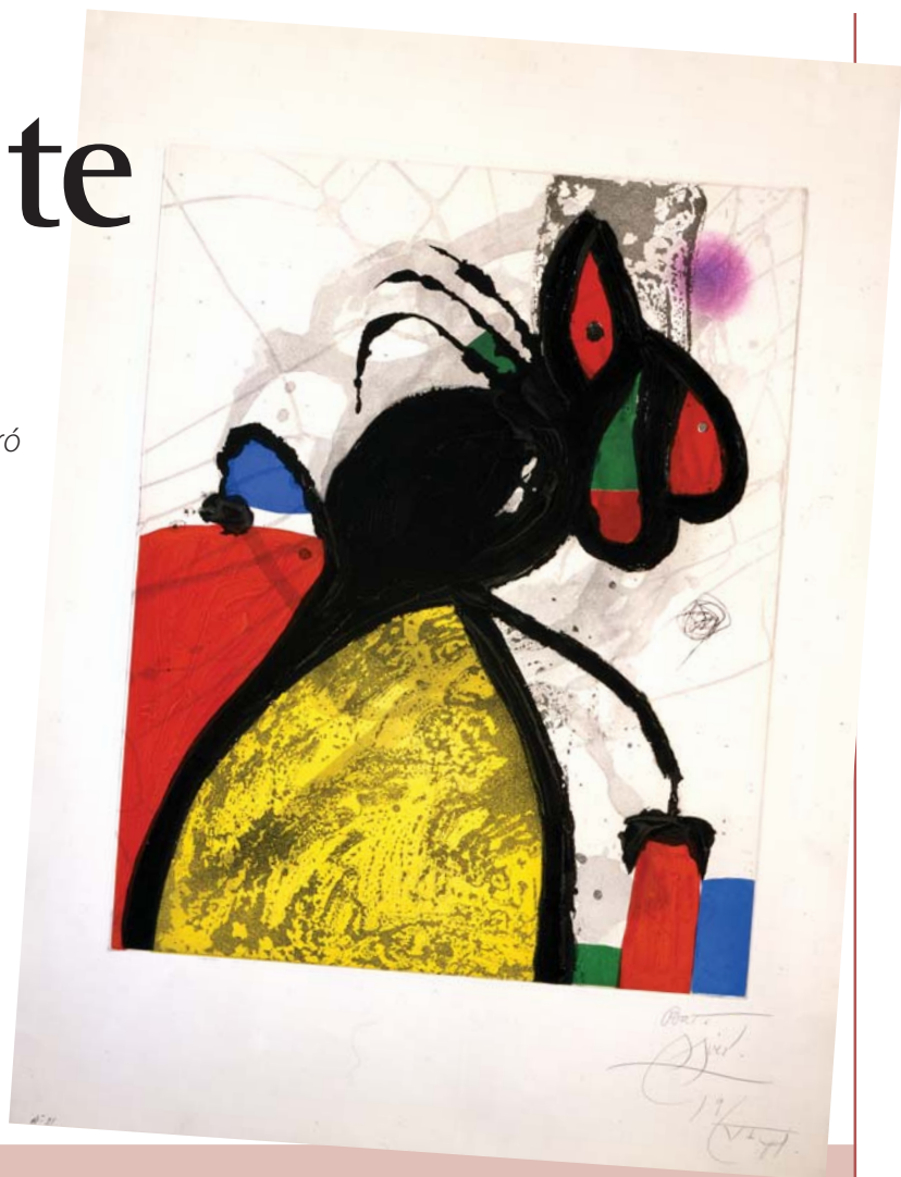
Joan Miró La Môme crevette Etching 1981 Edition of 80 - 96x75cm

Entrada gratuita. Agendamento de visitas pelo telefone (85) 3477 3319 ou pelo e-mail espacocultural@unifor.br