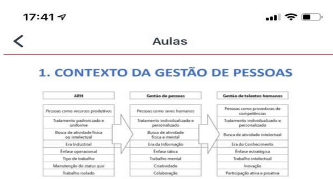
FIGURA 1 Os saltos gradativos da área de RH.